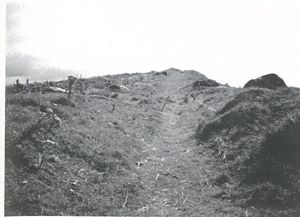
"Kvednaveien" frå Obrestad. Her oppe på "Kummelen".

Men slik vegen ligg i dag, som ein tydeleg "holveg" skoren ned i den turre bakken, ligg det nær å tru at ein her finn far etter ein oldtidsveg langs jærstranda. Og dette knytta til eit av dei mest stemningsskapande partia langs stranda, gjer parsellen til ei av dei vakreste perlene i jærnaturen. Diverre er også noko av dette stykket øydelagt ved dyrking, noko som sterkt under-