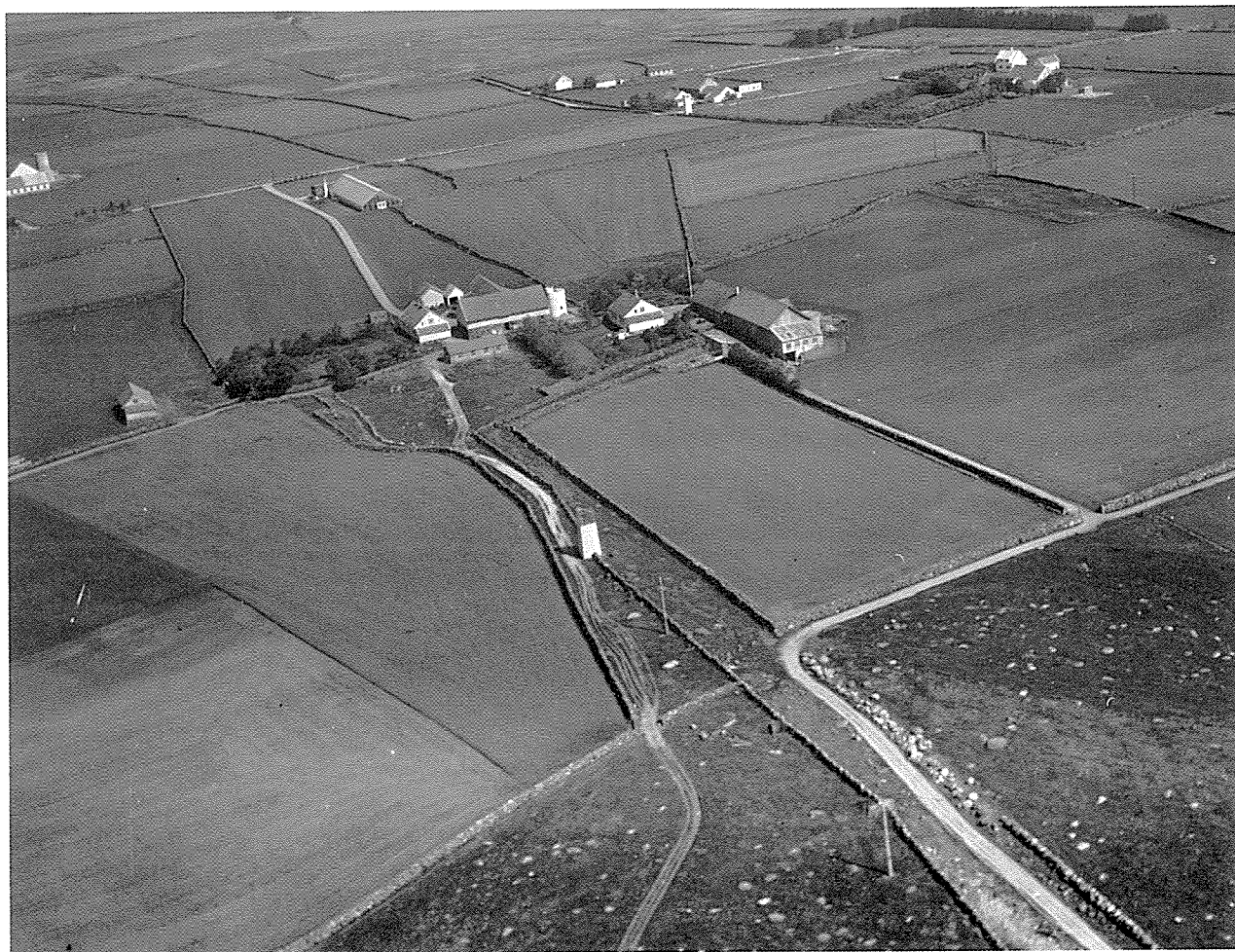
På Vigre er det minne om fleire vegar. Vegen frå Reime i framkant av biletet. Kongsleiet var rett sør for el-kiosken. Steingardlinja austover frå tunet markerer veg til Lode-Nesheim. Til venstre veg mot Obrestad. Midt i biletet den gamle tunstaden med br. nr. 1 til høgve og br.nr.9. Foto: Fjellanger -Widerøe A.S. 1954.