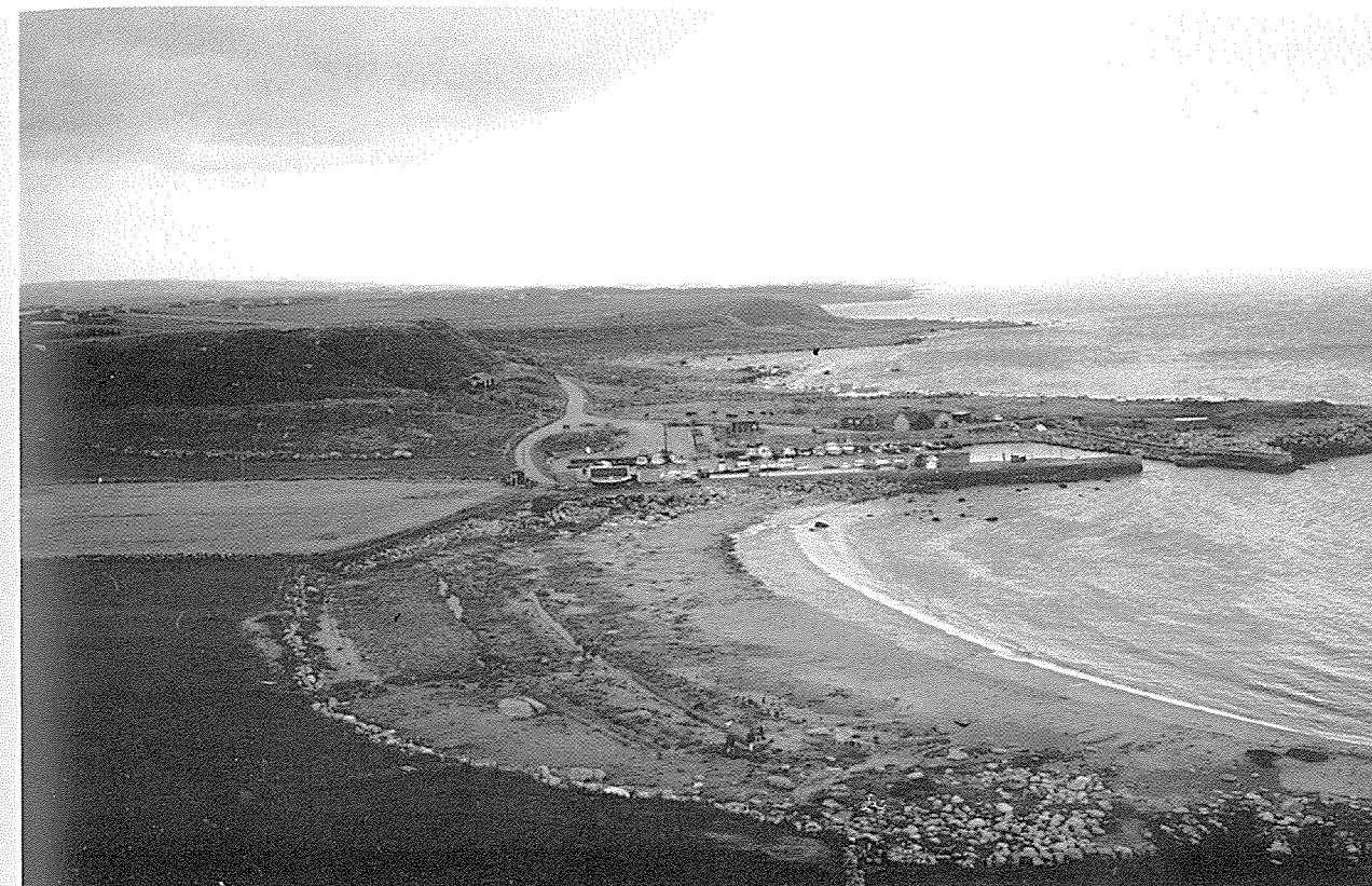
Utsikt frå Vetan på Obrestad.

På Hå gjekk vegen ned til vadet over åa omlag 100 m nedanfor den nye kloakkbrua. Både på Njærheim og Obrestad kaller dei staden "Med den gamla brunå".