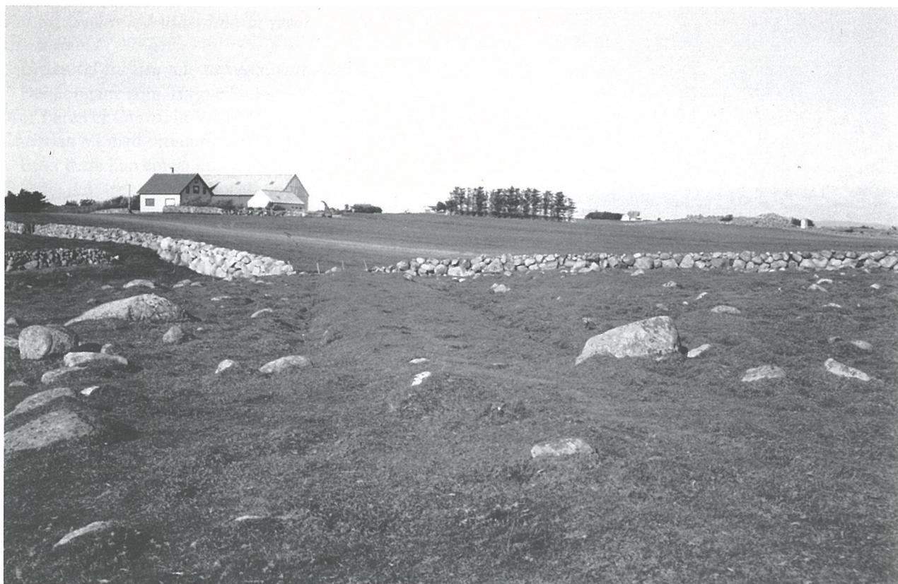
Heilt nord på Grødaland svinger den gamle vegen av frå stranda. Herfrå og nordover er alle spor etter vegen borte.