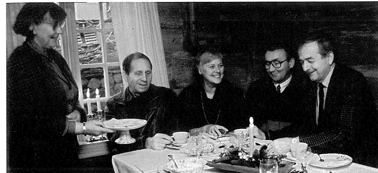
Tradisjonell matserving er ein triveleg måte å nærma seg huset og historia på.

Ei gruppe brukarar har vi ønskt særskilt velkommen – lærarstudentar, både dei som kjem og får eitpar Garborg-timar med utfordring til å gå heim og lesa og dei som etterpå kjem att og vil laga praksisoppgåve på