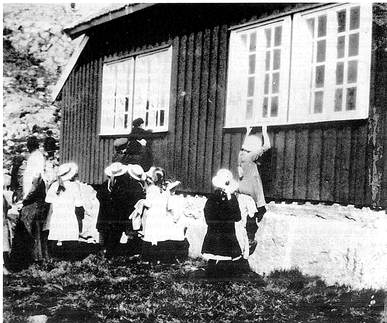
Tilrettelagd formidling har ikkje alltid vore nok påakta i kulturminnevernet.