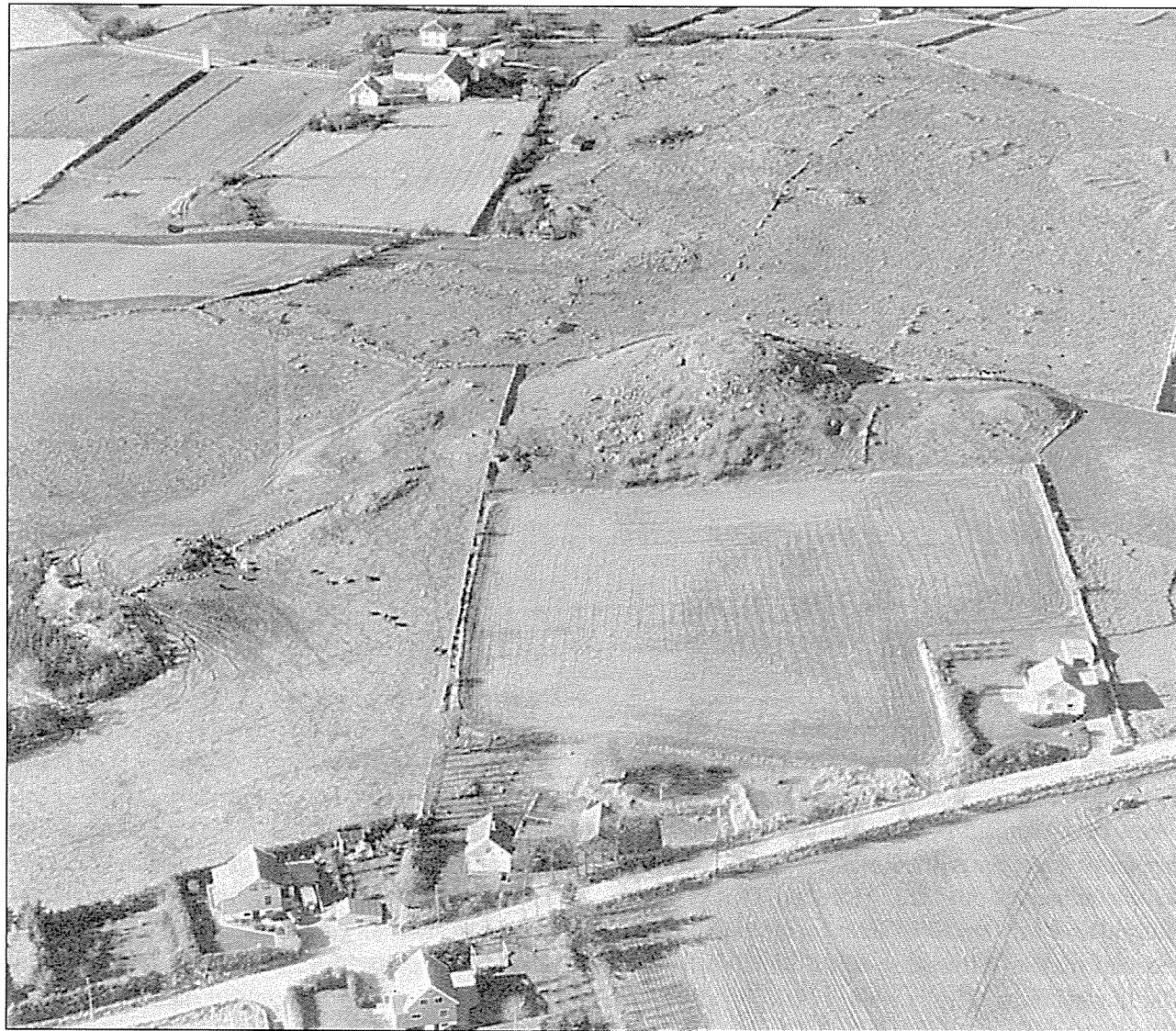
Det kan vera vanskeleg for bøndene å kombinera ivaretaking av ulike typer kulturminner når dei samstundes har sterke interesser knytta til nydyrking. I dette området er det omlag 20 gravhaugar som er verna.