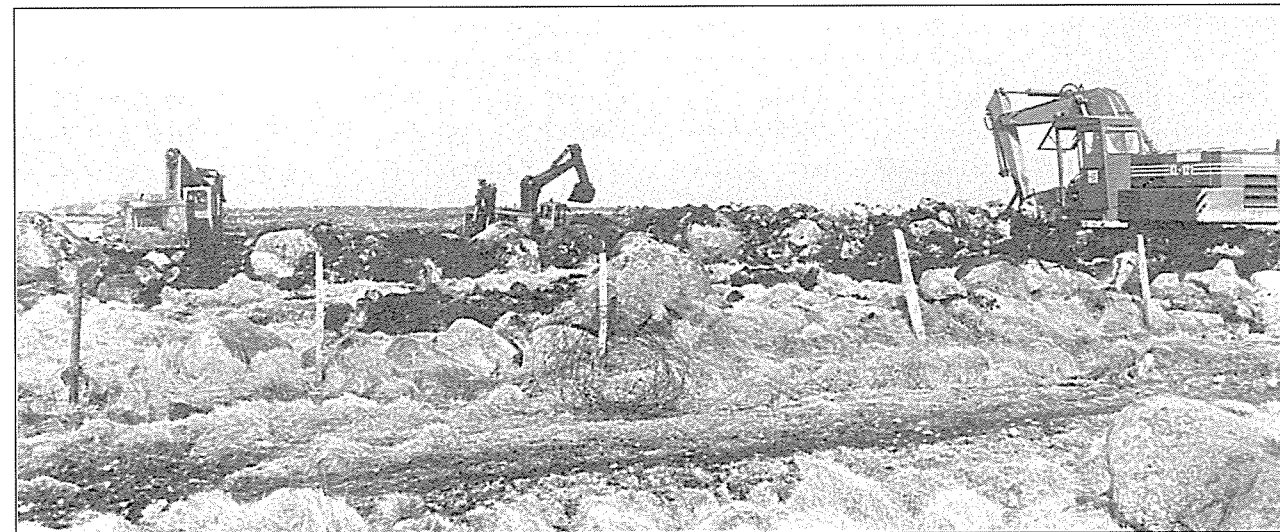
Gravemaskinane har hatt mykje å sei for nydyrkinga, og i den mest aktive perioden vart dei mest som ein del av kulturlandskapet på Jæren.

Her har eg gitt dykk ein liten peikepinn på dei tinga eg fann då eg dukka ned i materien for å skrive hovudoppgåva om Vår nye bondekultur. Men kva så når ein skal arbeide med kulturvern på Jæren. Fyrst av alt trur eg det er viktig at uansett kor ein har sitt virke, så skal ein aldri gløyme kven ein arbeider for og med. Men når det dreier seg om ivaretaking av gamle jærhus,