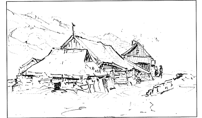
«.....ved første Øiekast finder man disse Hus-klynger for uanseelige» skreiv Eilert Sundt om byggeskikken på Jæren.

Og som Landet, saa og menneskenes Boliger; ved første Øiekast finder man disse Hus-klynger for uanseelige; men har man først sat sig ind i Omstændighederne og faaet Øie for Husformenes Hensigtmessighed, og har man derhos reist over Jæderen længe nok for å kunne se, hvorledes Folket idelig sysler og stræver med at