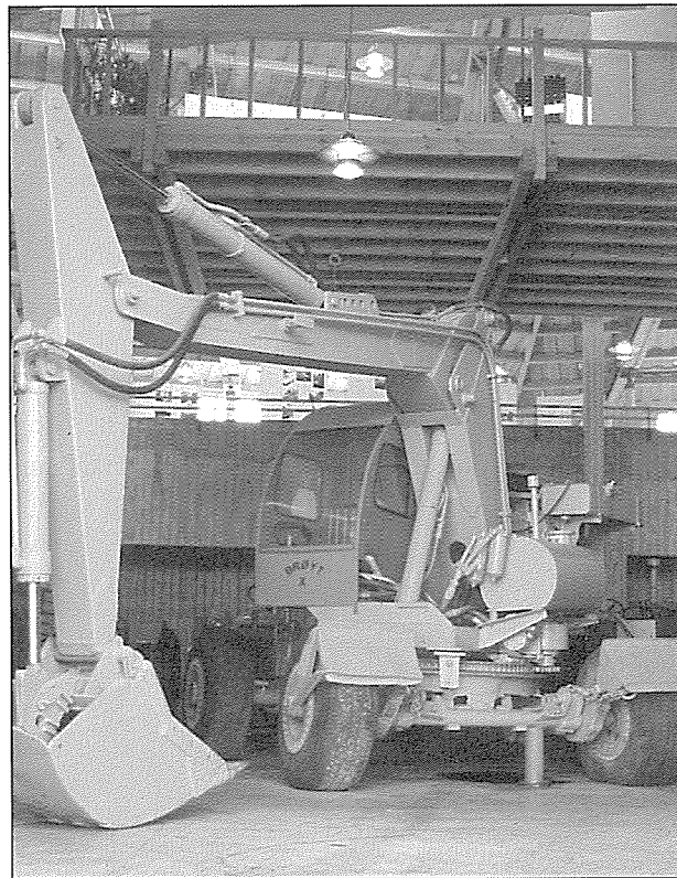
Nokon har kanskje eit tvetydig tilhøve til Brøyten. Samstundes som han gjorde ein kraftinnsats for nydyrkinga på Jæren, har han også vore med på å jamna deler av kulturarven i regionen med jorda. Denne prototypen på den hydrauliske brøyten står i utstillingslokalet til Jærmuseet.

Kan ein seie at bøndene i generasjonar har overteke forfedrene sine måtar å takle framskritt, endring og ivaretaking på? Kanskje spelar òg tanken om kor viktig det er å gjera rasjonelle val inn her? Kva får dette i så fall å seie for jærboenden? Kva tradisjon er det dei byggjer på, og kva utslag gjev det i kvardagsleg praksis i dag? Kan ein seie, på tross av at mange nok vil hevde det motsette, at kjenslene og tilhøvet dei har til heim-