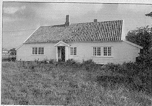
Det gamle jærhuset ligger ike ved Varhaug gamle kyrkjegård. Huset var frå 1850-1860.