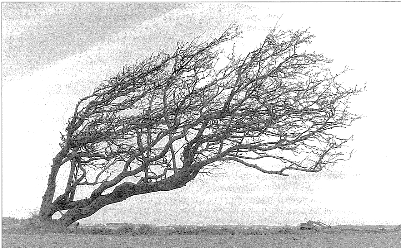
Tre som bøyer seg for nord-vesten er eit av kjennemerke på det jærske landskapet.

landskapet dei sjølv har vore med på å skape (Krogh 1996). Denne aktiviteten som er så sjølvstekt for dei vert det vanskeligare å setje ord på enn dei fenomen som det eksisterer ein klar retorikk kring. Det er lettare å fortelje om kor mykje det opne og skakkblåste landskapet tyder for den tilhøyra dei kjenner til Jæren, enn å snakke om korleis den kroppslege aktiviteten, gjennom arbeidet med nettopp dette landskapet, gjev