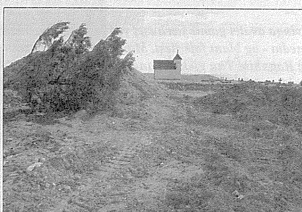
Jærhuset ved Varhaug gamle kyrkjegård er no berre utan spor. Berre etn gravhaug ligg igjen på eigedommen.