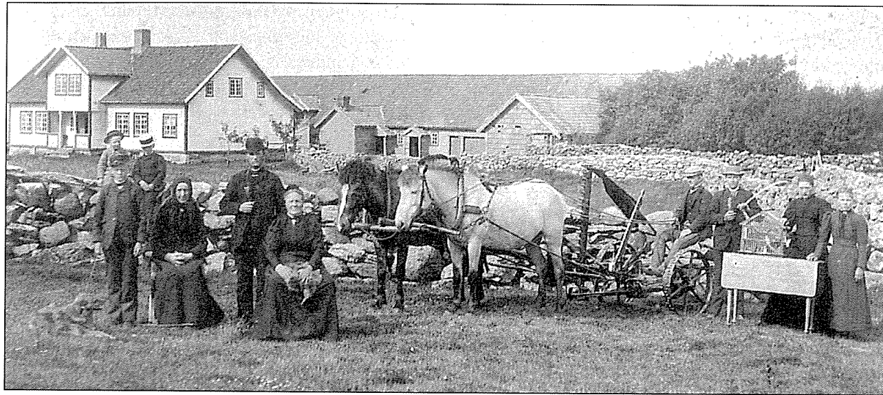
Her får me eit inntrykk av korleis ein jærfamilie ynskte å framstå kring århundreskiftet. Dei har stilt seg opp i sundags-stasen med gardshusa i bakgrunnen. Kona i huset sit med strikkesøyet i hendene og slåmaskinen er og sentralt plassert i biletet. Frå Særheim i Klepp kring 1905.