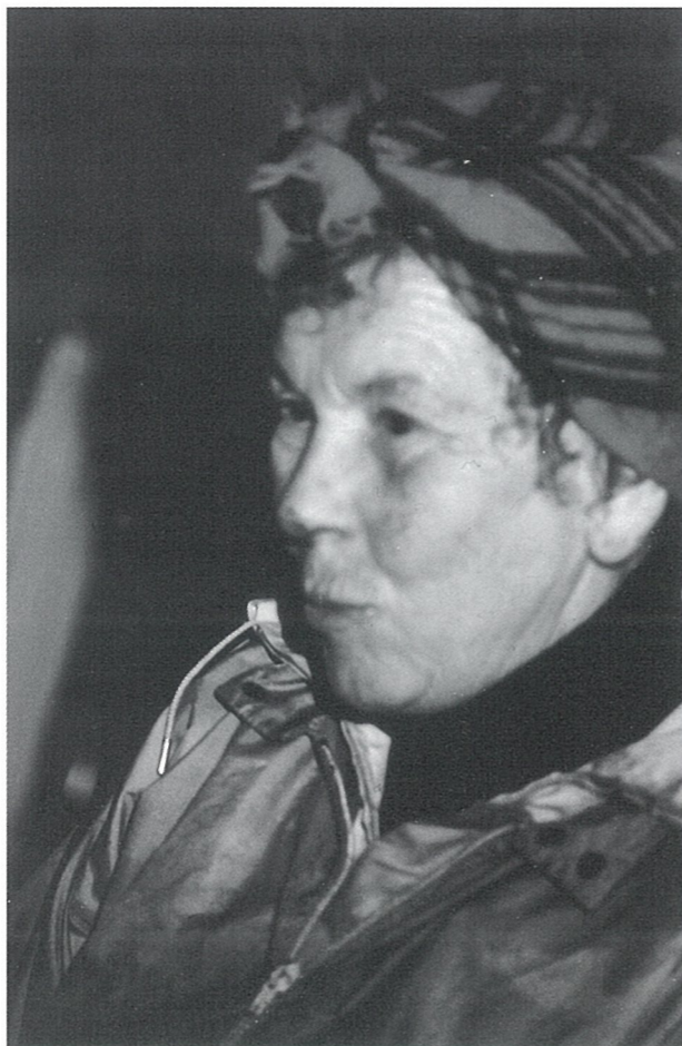
Tora Vigre i gulrothabitt hos Undheim'en på Åse, truleg ca. 1970.

Då einfrøsmaskinane kom etter 1960 fall tynninga bort, og dei nemnde sprøytemidla gjorde luking mindre turvande. Til gjengjeld jobba nokre gjengar med plastutlegging frå mars. Her måtte ein lenge