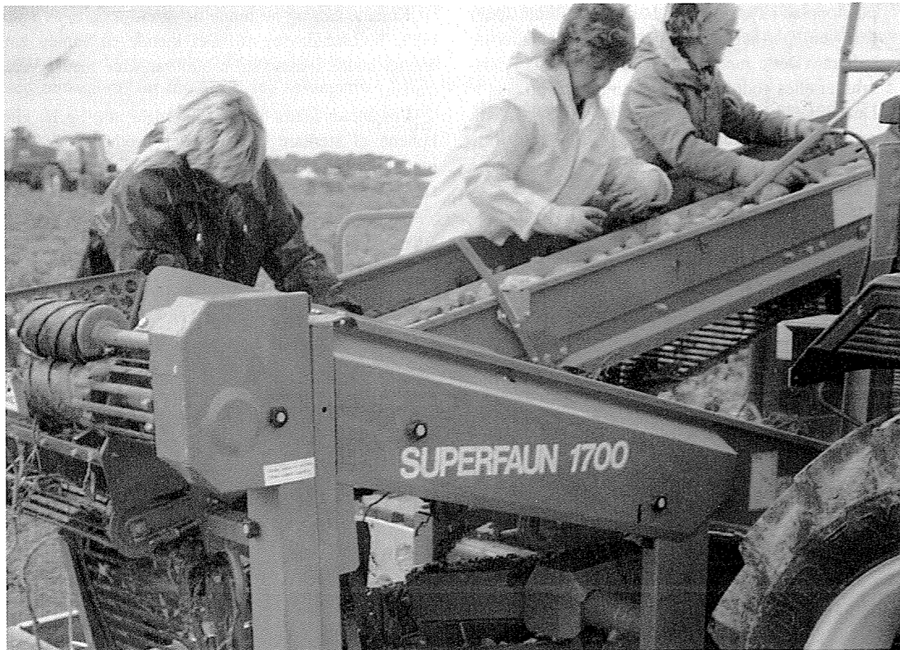
Opptaket av poteter og grønsaker blei mekanisert. Her er det opptak av poteter rundt 1990, og me ser at det framleis er bruk for koner. Ikkje dei store gjengane som tidlegare, men 2-3 stykker. «Det er dei som er rappe på fingrane».

Då gulrotproduksjonen auka etter 2.verdskrig, var som nemnt, ikkje mekaniseringa på dette området komen særleg langt. Konegjengsystemet voks fram som eit svar på produsentane sin aukande trong for