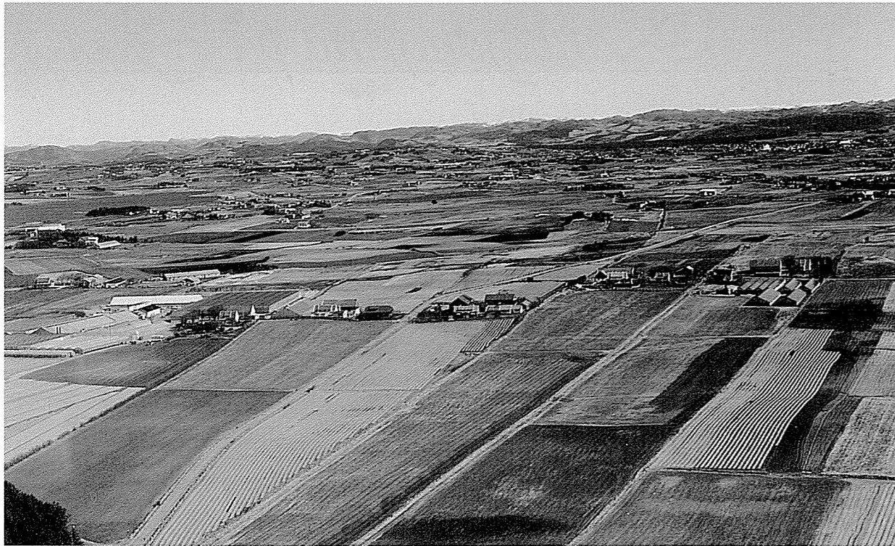
Gulrotbeltet strekker seg frå Sola og søre delen av Sandnes i nord via Klepp, sørover til og med Ognå. Her er det god sandjord som eignar seg ypperleg til gulrotproduksjon. Bildet er frå sjøgardane på Vik i Klepp mot fjella i aust.

namn på potensielle informantar gjennom lokalkjende folk intervjuarane kjenner frå før. Så kan ein få nye namn av dei ein ringjer til, eller får intervju med osb. Snøballen rullar med andre ord, om ikkje nett av seg sjølv.