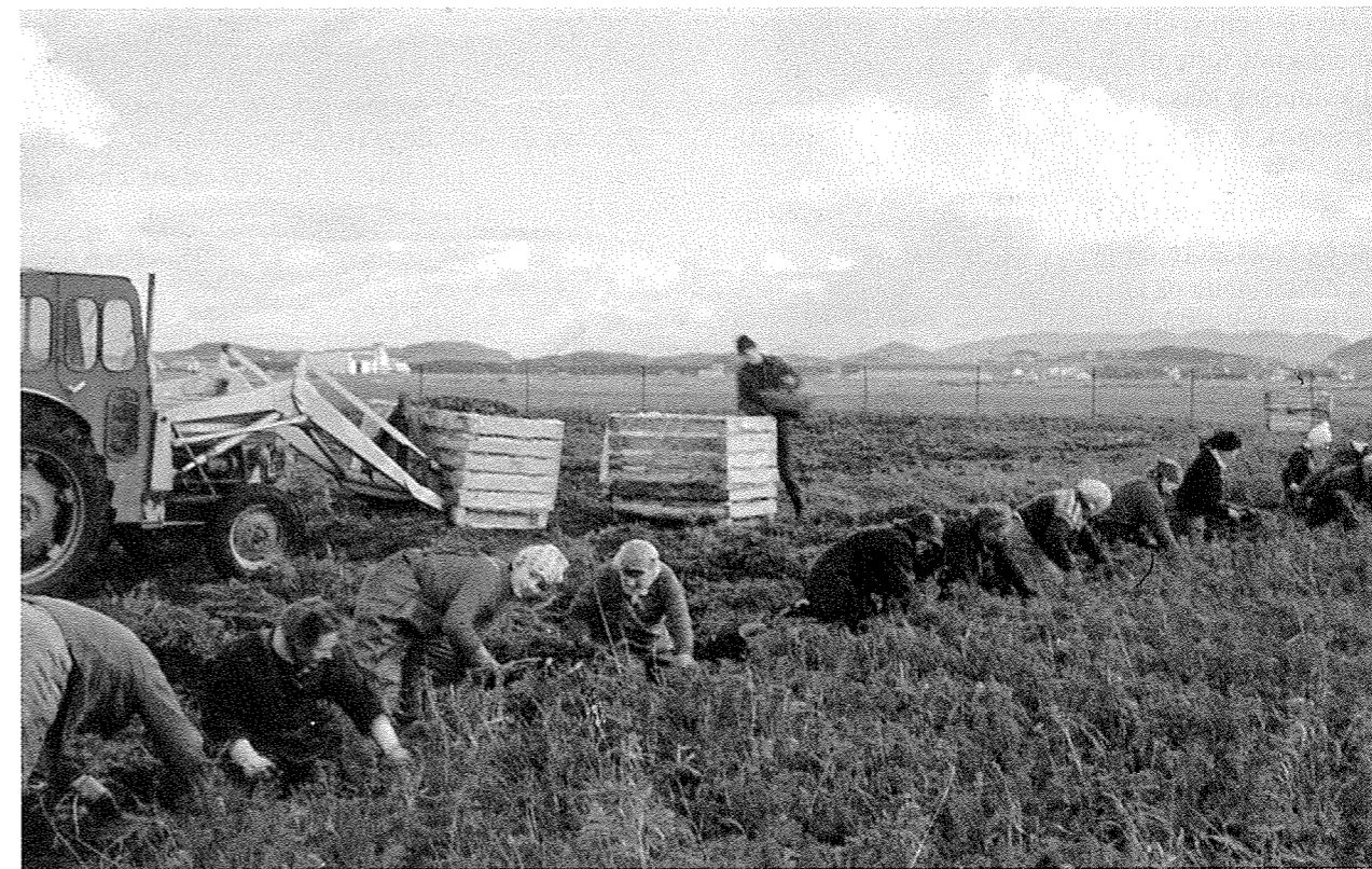
Konegjeng hos Abraham Hedland på Tjelta i Sola. Det er på midten av 1960-talet, me kan sjå flyplassen i bakgrunnen. Konene er frå sørbygda i Sola.

Ida Blom forklarar auken i trongen for kvinneleg gift arbeidskraft frå 1960-åra, om lag slik: Lågare gif-