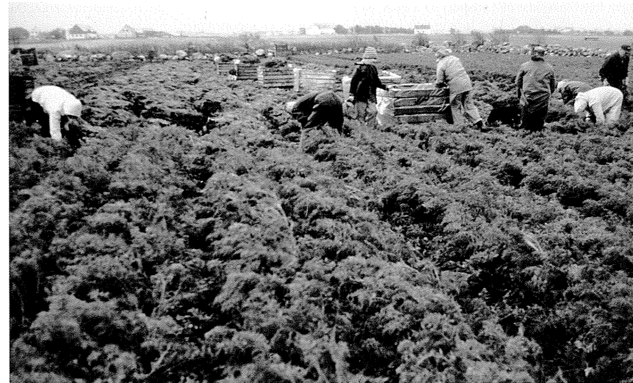
Konegjeng i sving med gulrøtene hos Undheim på Åse.

Somme tider var fleire gjengar i sving hos ein og same oppdragsgjevar. Eit par av dei har opplyst at dei kunne ha 25–30 koner og andre (ungdomar) i arbeid på ei og same tid. Dette gjaldt haustopptak. Særleg på tidleggulrot hadde mange koner halvaksne ungar med. Dei førte timelister sjølv. Dei fleste gjengane hadde 8–10 medlemmer. Ein hadde 16. Desse tala må ein ta med eit visst atterhald. Fleire hadde problem med å hugse alle som hadde vore med. På den andre sida er det ikkje sikkert at alle dei hugsa var med samstundes.