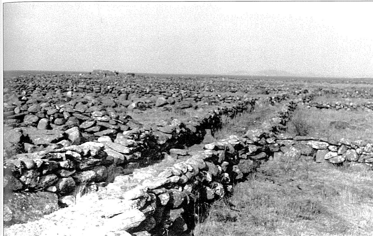
No er det lite igjen av stille vatn eller små teigar avstengde med steingardar på Jæren.

hildirar dei seg halvt burt, sveiper seg i torvrøyk og havdis som i ein draum; stengde og stille ligg dei burtetter viddine som tusseheimar. Rundt husi skimtar det fram bleike grøne flekkir av åker og eng som øyar i lyngviddi; kvar bite og kvar lepp er avstengd og innlødd med steingjerde som lange røysir.