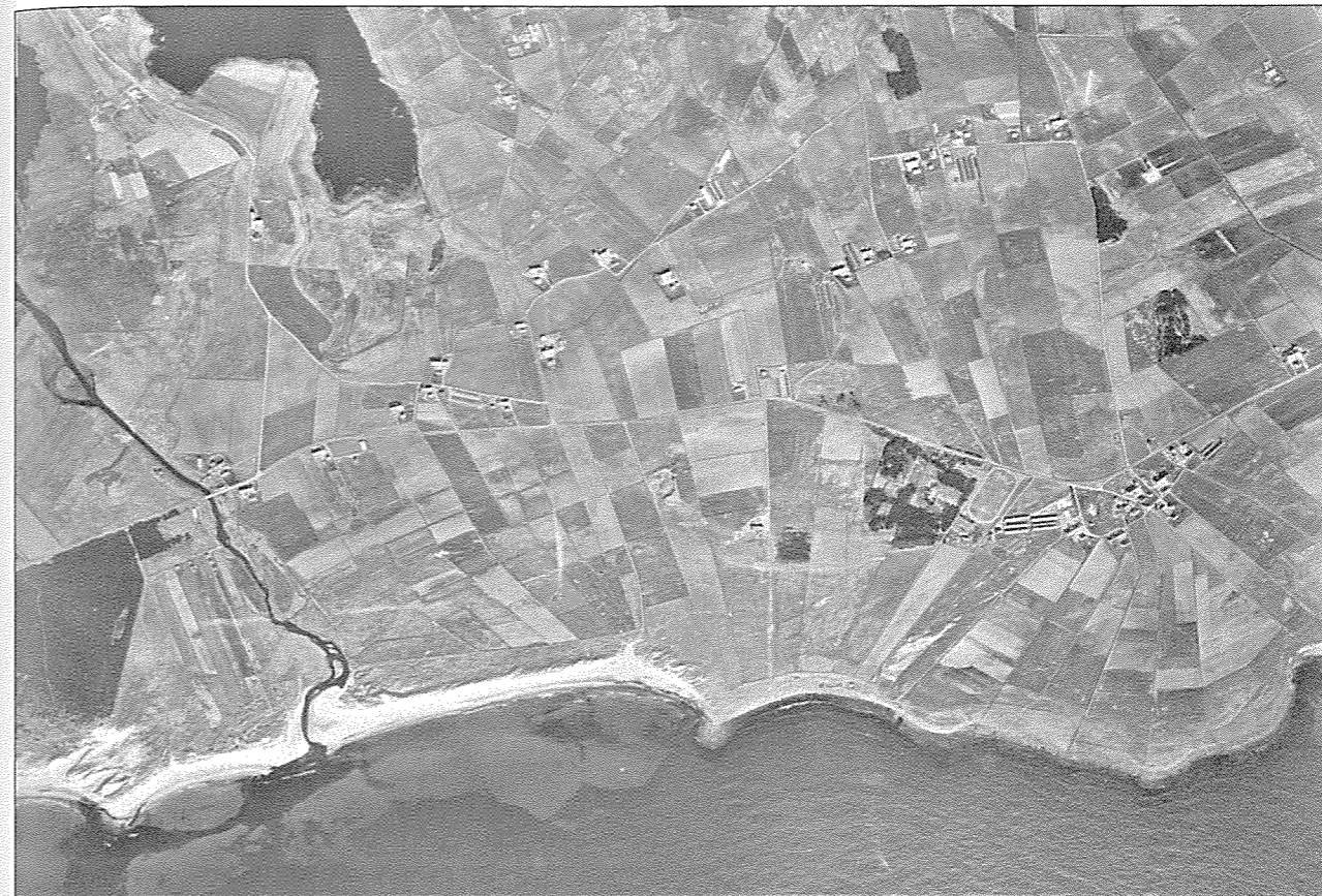
Dt mangfoldige jærlandskapet - eit mindreverdige landskap? Frå Vik i Klepp 1966.

Landskapet er det du ser, mente mange av bøndene. Et landskap har utvilsomt visuelle kvaliteter, det er det man ser rundt seg, og som vi kan oppfatte både positivt og negativt. Mer spesifikt mener Ove at " Jæren er et spesielt landskap i Norge ". Jæren har altså kvaliteter som er typiske for Jæren. Også innenfor Jæren er det ulike landskap. Dette spesifiserer Oddlaug på følgende