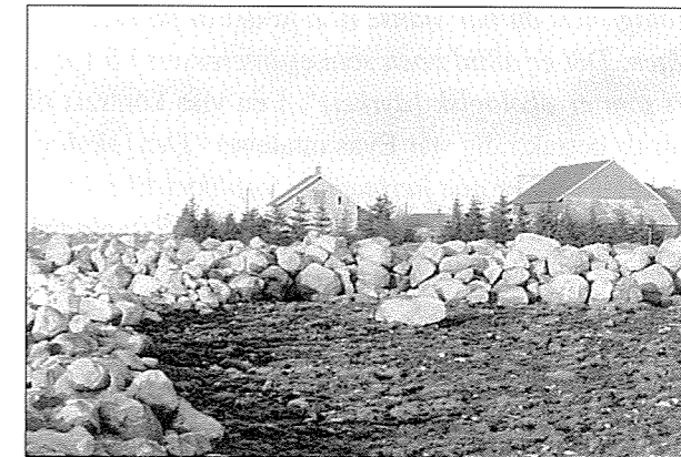
Med gravemaskinene kom dei store dyrkingsrøysene.