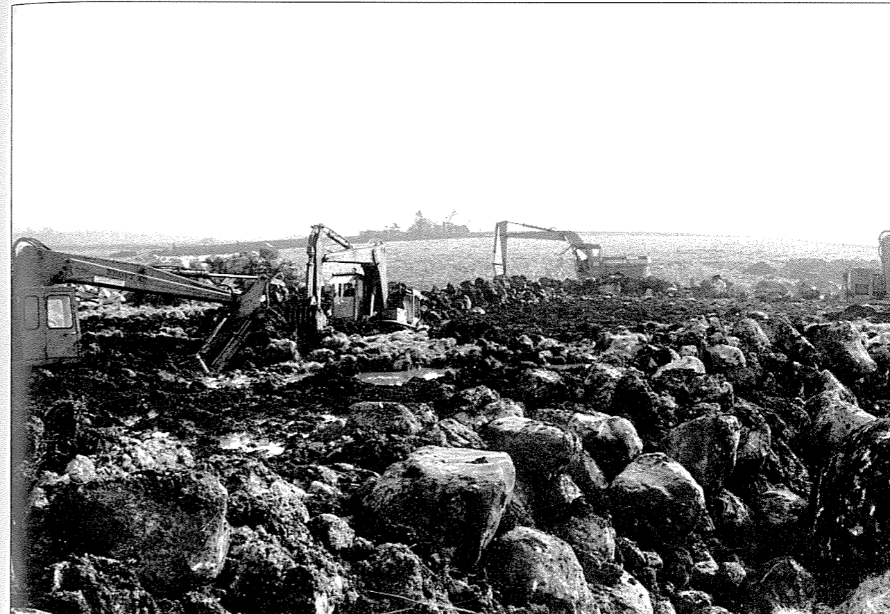
På dyrking i 1970-åra.

innbakt i produksjonen av kulturlandskapet. Vi har sett at kulturlandskapspolitikken rettes inn mot et fortidig landskap, et 1950-tallslandskap. Bøndene opplever i stor grad dette som stagnerende. Dette henger sammen med hva man oppfatter som landskap, og landskapets rolle i forvaltningssammenheng. Landbruks- og miljø-