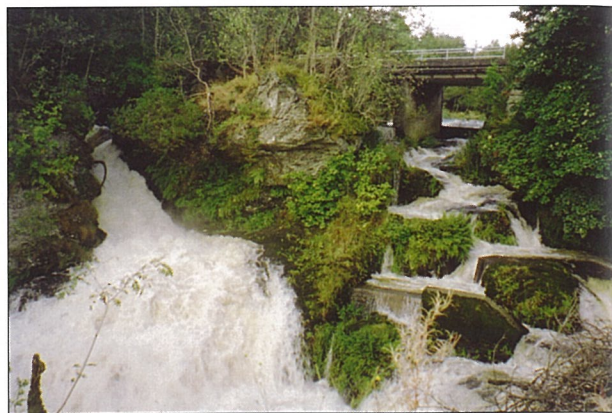
Fotlandsfossen brusar heftig i haustflaumen i august-september 2004. Det er rikeleg med vatn i laksetrappa bygt i 1952. I bakgrunnen er den nye Fotlandsbrua. Brukaret til den gamle ligg bak bergknausen midt i biletet.

1. november 1865 vart det tinglese følgjande: