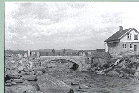
Undheim bru står ferdig, og den gamle brua er fjerna og materiala selde. Det er Årestadgarden vi ser i bakgrunnen. Det vesle huset i åkanten er ei av dei mange bekkakvernane som låg til åa på Undheim.