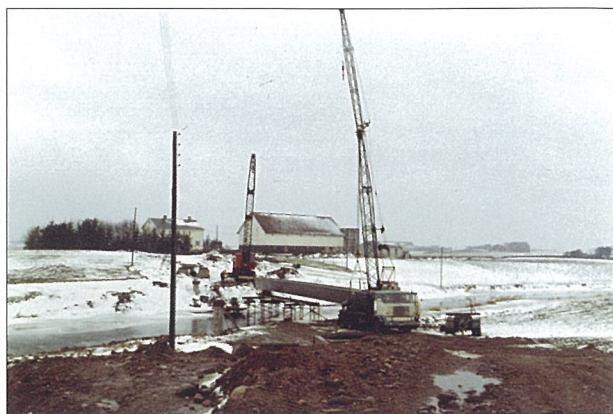
På 1960-talet blei den gamle hengebrua på Nesheim riven og Br. Risa la kloakken frå Nærbo til sjøen i denne traudragaren. På toppen blei det montert ei ny gangbru, som framleis er i bruk.

Lengst ned i elva er det ei anna hengebru. Ho vart sett opp i 1920. Det er ei privat bru som vert halden i god stand. Eigara er gardane Nærland og Hå. Det er