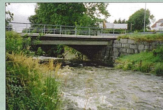
Undheim bru etter utvidinga frå 2,5 meter til 6 meter i 1952. Den gamle steinkvelven frå 1901 kan vi skimta under brua. Det første meieriet på Undheim låg der treklynga i framgrunnen nå står.