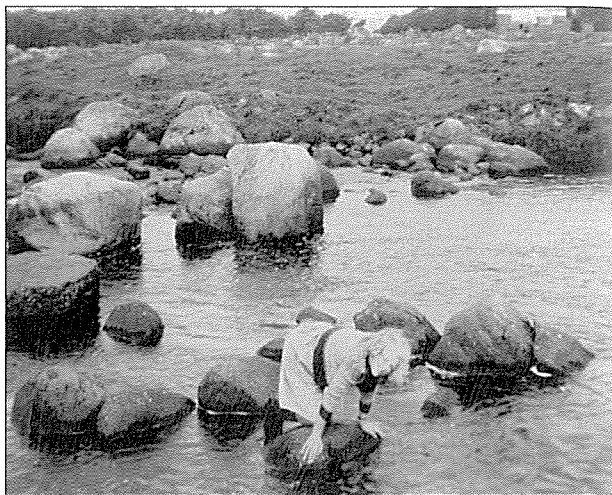
Det var mange køyrevad og gangsteinar over Håelva – og ein og annan staden la folk over ein planke til å balansere tørrskodd over, og av den grunn heiter det "planken" både den eine og andre plassen. Eit døme på gangsteinar finn vi på Grødem. Litt lenger oppe i elva var det køyrevad.

Men folk har ikkje lete seg stansa av djupt vatn. Vinterstid med frostvêr ga god og sterk is til å gå på og køyra på med øyk og slede. For å hjelpa seg når isen bråna i flaumane seinare - same kva årstid det var - var det greitt om ein kunne ordna seg for å koma tørrskodd over når vatnet sto høgt i åa. Då vart det brukt steinslede og køyrt utpå isen store steinar som sokk når isen smelta, eller det vart hogd hol i isen så ein var sikker på at steinane kom dit dei var etla. På den måten vart det steinar til å hoppa på tørrskodd frå den eine sida til den andre. Denne måten å ordna seg på for å koma over ei å, skal det vera lite av andre stader i landet - helst bare i Rogaland. Det kan vel skuldast at åene våre her på Jæren stig fort ved nedbør og går raskt attende ved opphaldsvêr. Det er ofte bare spørsmål om nokre dagar det ikkje er vassande over. Då er store og trygge steinar