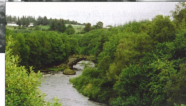
Fosse bru sett frå den nye brua lenger nede i elva. Legg merke med korleis det har grodd til med tre og buskar langs åa.