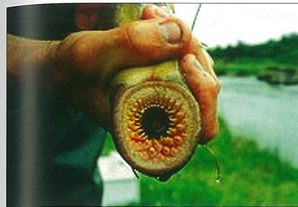
Med dette gapet lurer havniøyene seg inn på større fisk. Med horntennene biter den seg fast bak på fisken, og suger ut muskler og innvoller til fisken dør.

Når lambretten vert kjønnsmoden vender dei tilbake til ferskvatn og gytt. Havniøylene vert størst. Dei blir