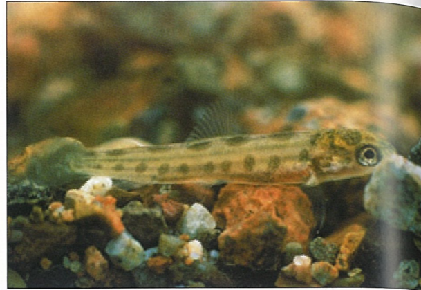
Laksyngel. Suldalslågen. Laks og kraft, Statkraft Grøner as, 2000.

dei går ut i sjøen. Desse småfiskane lurar seg inn under ho akkurat i det ho gyt, og kan befrukte opptil tredjeparten av rogn. Det er derfor som regel mange fedrar som bidreg i ei enkelt gyting. Sviddene i Håelva gyt mellom 3 500 og 6 500 rogn, og laksen mellom 7 000 og 17 000 rogn som blir fordelt på 10 til 20 gytingar. Dersom det er lite vatn i elva i november kan ein nokre stader, som ved Fotland Kraftstasjon, følgje gytinga frå land. Då får ein sjå dette flotte naturfenomenet på nært hald.