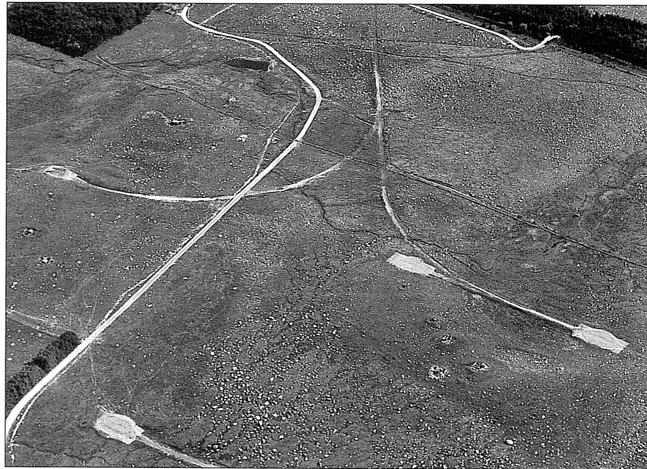
Flyfotografiet viser tydeleg traseane etter jernbanespora og oppstillingsplass for kanonene.

Etter krigen vart jernbanekanonane transporterte til