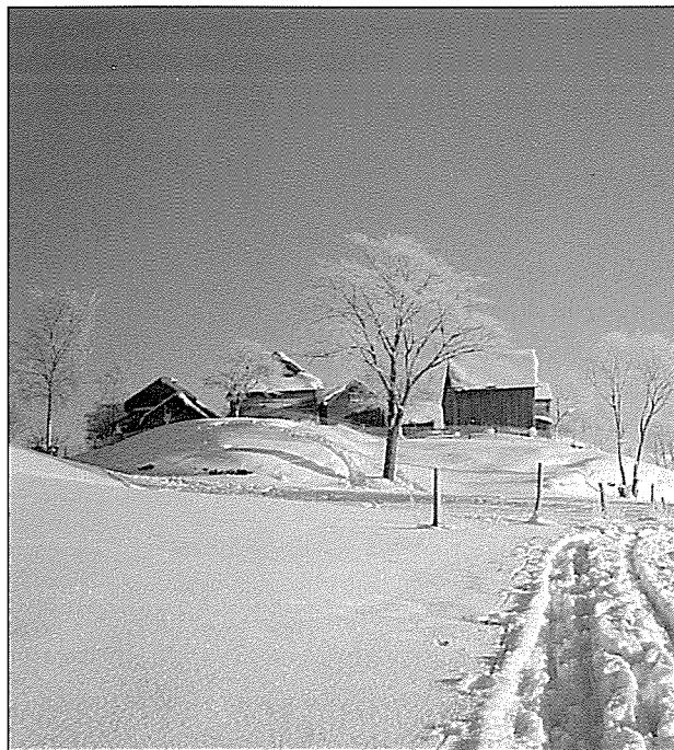
Tradisjonell vestlandsgard, frå Voss.

Med posisjon har eg meint den reelle plassen kvinnene har i arbeidsorganiseringa på bruket, kva dei gjer eller ikkje gjer. Posisjon er altså nytta om noko som let seg iakttå. Holdningar til arbeid tek derimot utgangspunkt i dei subjektive opplevingane individet har av arbeidet og arbeidssituasjonen, og den let seg ikkje utan vidare beskrive ut frå åtferd eller handlingar aleine. Holdningane er blitt forklart som ein disposisjon hos individa, og som omfattar tankar, kjensler og kunnskapar.