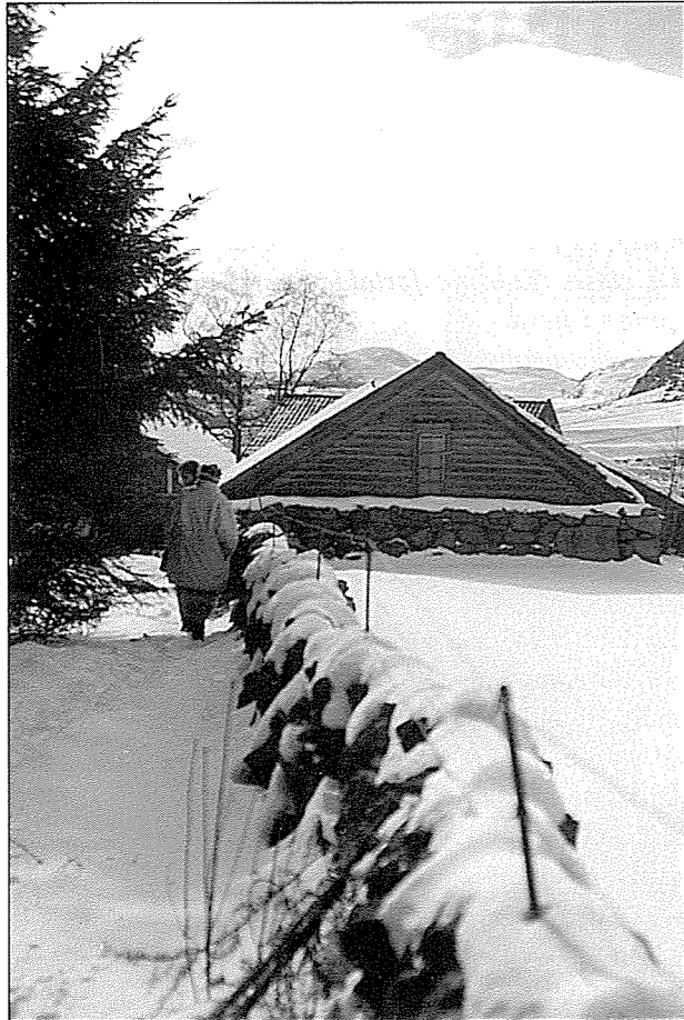
Frå garden Krogedal i Sandnes. Foto: *Jærmuseet, 1988.

i forma. Så tok ho bråna fett i frå sauainnmat, og helte oppi forma som var nokolunde tett i eine enden. Tok så nokre heimelaga lysestakar, og sette desse formene oppi. Når så massen inni forma var storkna og kald, tok ho tak i den bomullstråden som var